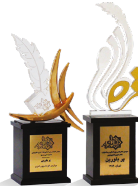
سیستم اتوماسیون اداری پیوست در سالهای ۱۳۸۸ و ۱۳۸۹ برنده تندیس پر بلورین برترین اتوماسیون اداری کشور از دومین و سومین کنفرانس بین المللی نظام اداری الکترونیکی شده است.

استفاده از معماری چند لایه این قابلیت را به اتوماسیون پیوست می دهد که بتوان آن را در آرایش های (Deployment) متنوع سخت افزاری مورد استفاده قرار داد، بعنوان مثال با امکان جداسازی دستگاه های سرویس دهنده اصلی، سرویس دهنده پایگاه داده، و سرویس دهنده وب، می توان کیفیت، سرعت و امنیت را بطور همزمان ارتقاء داد و یا با استفاده از انباره های اطلاعاتی عظیم، نگرانی از رشد فزاینده اطلاعات را از بین برد.