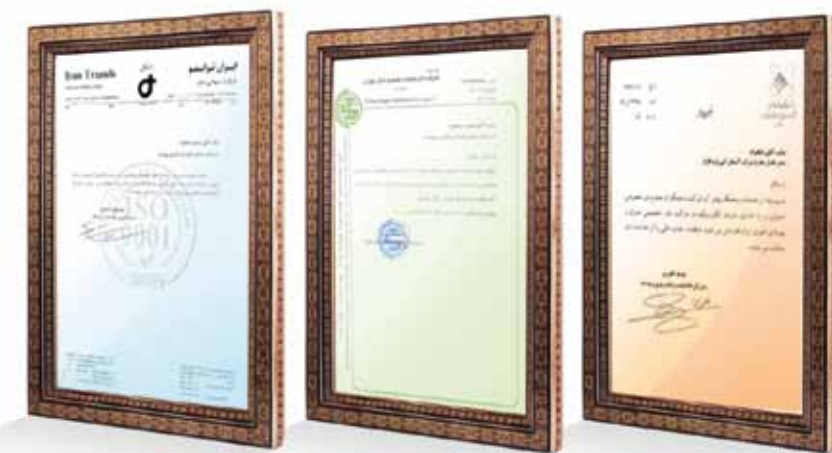
همچنین گروه نرم افزاری پیوست برای استقرار و پیاده سازی سیستم های اتوماسیون اداری در صدها پروژه در سالهای مختلف فعالیت، از سوی مشتریان گرانقدر خود، مورد قدردانی و تشویق قرار گرفته است.